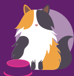
Koty ze skłonnością do nadwagi