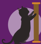
Gatos de Interior